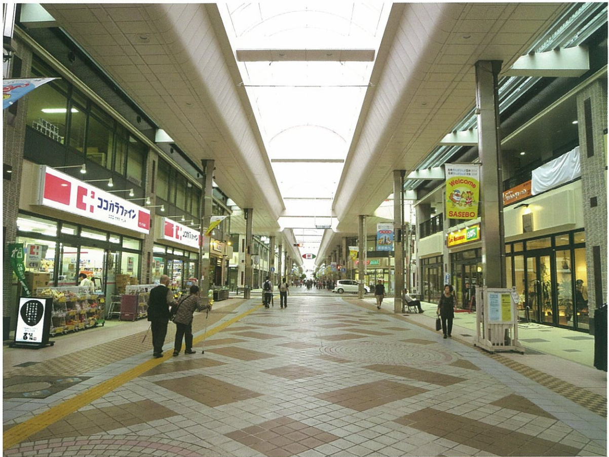
アーケード内(栄町)