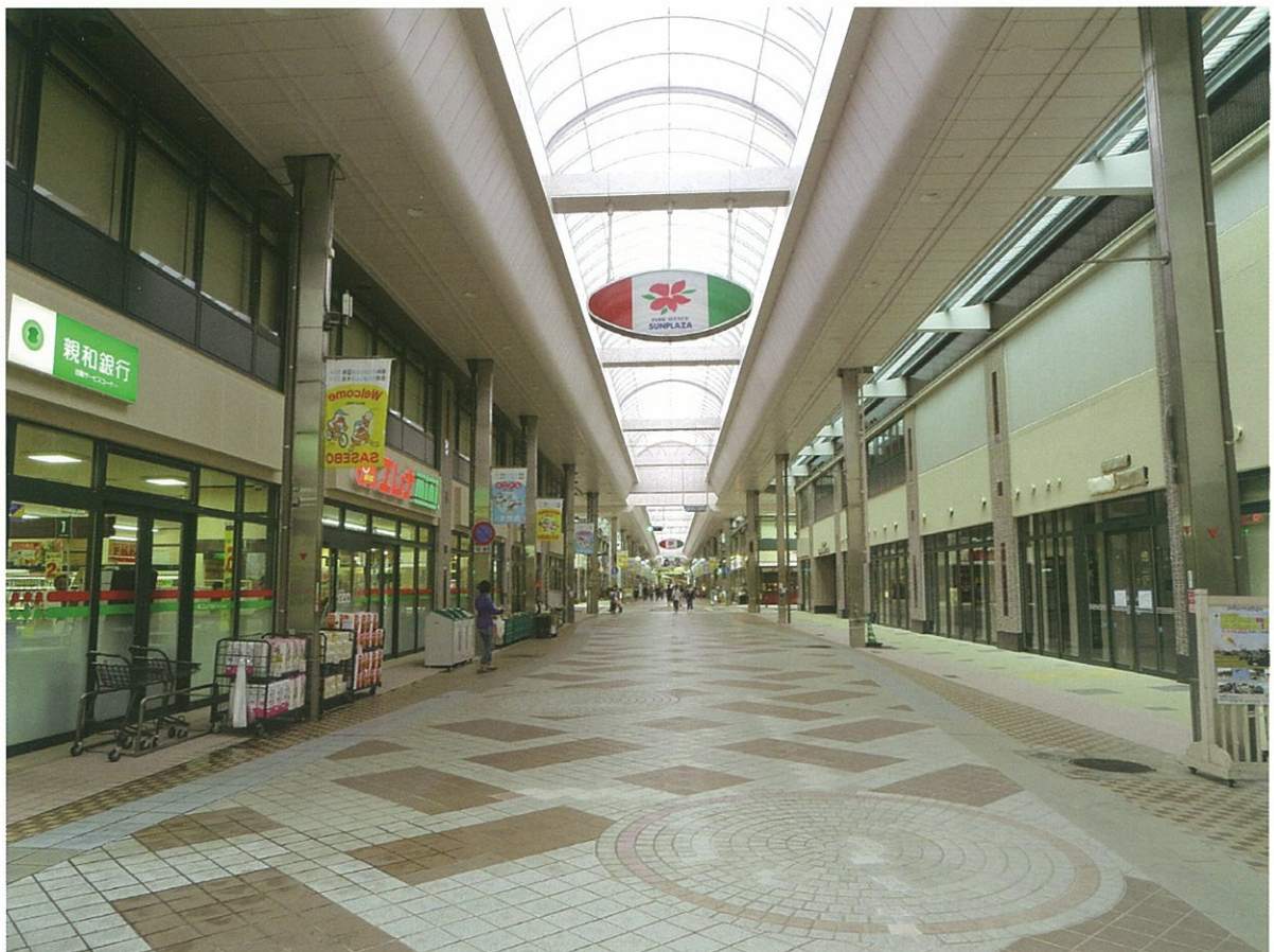
アーケード内(常盤町)