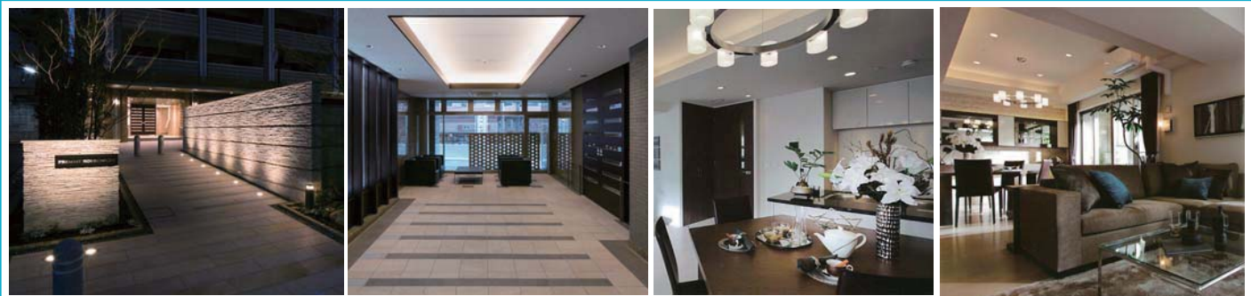
▲ 施行再建マンション