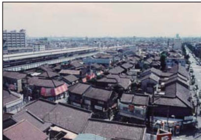
● 六甲道駅前地区 第一種市街地再開発事業

その後、平成27年（2015年）3月には神戸市よりマンション建替法に基づき権利変換計画の認可を受け、同年9月より新築工事に着手し、平成29年（2017年）3月には、施行再建マンションが竣工する運びとなりました。