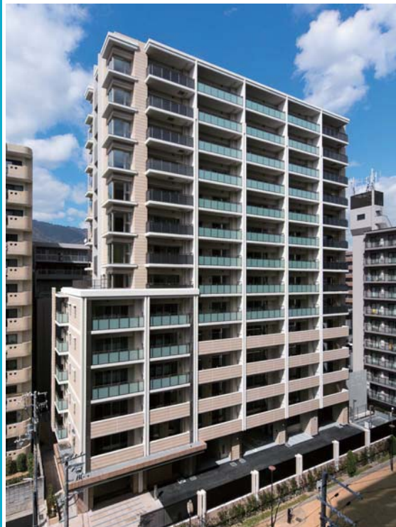
プレミスト六甲道