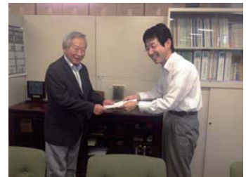
● マンション建替組合設立認可