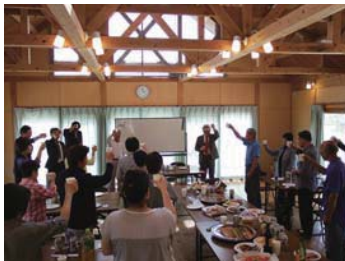
● お別れ会（平成27年5月17日）