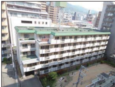
● 従前（宮前グリーンハイツ） 昭和56年竣工