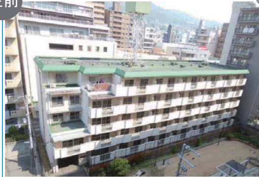
宮前グリーンハイツ