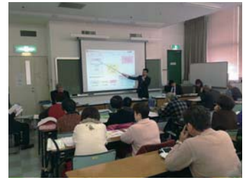
● 区分所有者説明会