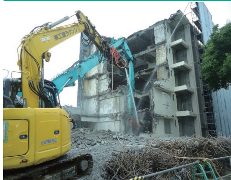
③ 建屋の解体工事着手（2021年9月）