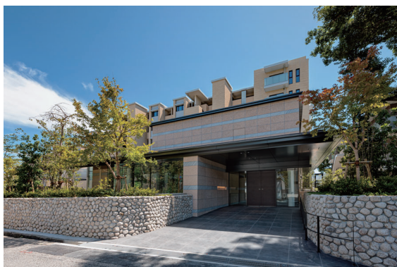
エントランス外観