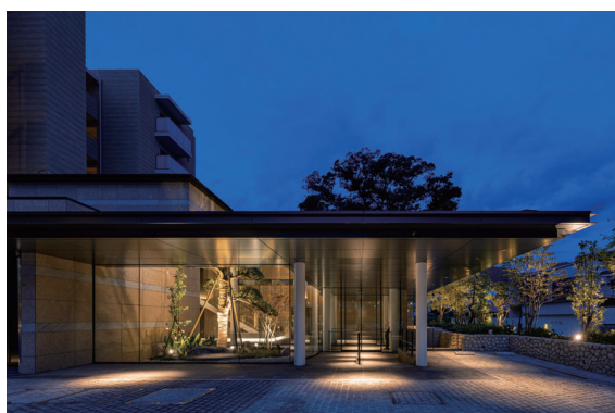
サブエントランス(夜景)