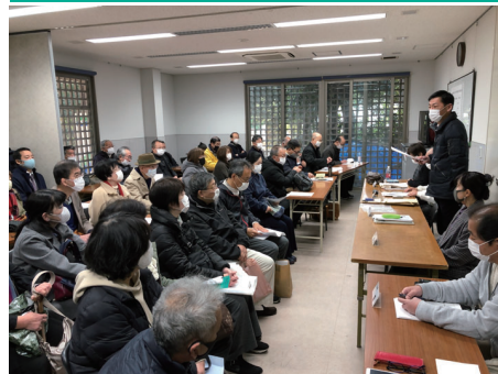
② 建替え決議集会（2020年12月）