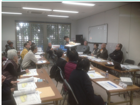
① 替え基本構想説明会（2018年12月）