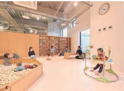
はこだてキッズプラザ