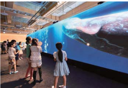
はこだてみらい館